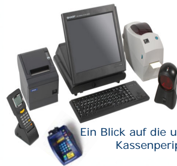
Ein Blick auf die umfangreiche Kassenperipherie

Die Baumärkte haben einen spezifischen Workflow . Die Belegabwicklung (Aufträge mit Anzahlungen, Rücknahmescheine, etc.) wird durch SOFTLINE ERP von der Auftragserfassung bis zum Anzahlungseingang (Kassa oder Banküberweisung) überwacht. Die Präzision bei der Abwicklung der Geschäftsprozesse erhöht die Kundenzufriedenheit und Lieferqualität .